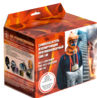
Коробка для хранения

Самоспасатель в герметичном пакете упаковывается в коробку или сумку, на которых размещаются памятка по применению. Упаковка пломбируется, вскрывается в случае пожара или ЧС техногенного характера. Сумка 2 соответствует требованиям Российского морского регистра судоходства (РМРС).