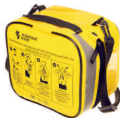
Сумки для хранения и ношения